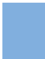
Myra Lwintzer, København

Team ÖresundsLimmud 2014 Team ÖresundsLimmud 2014 Team ÖresundsLimmud 2014 Team ÖresundsLimmud 2014